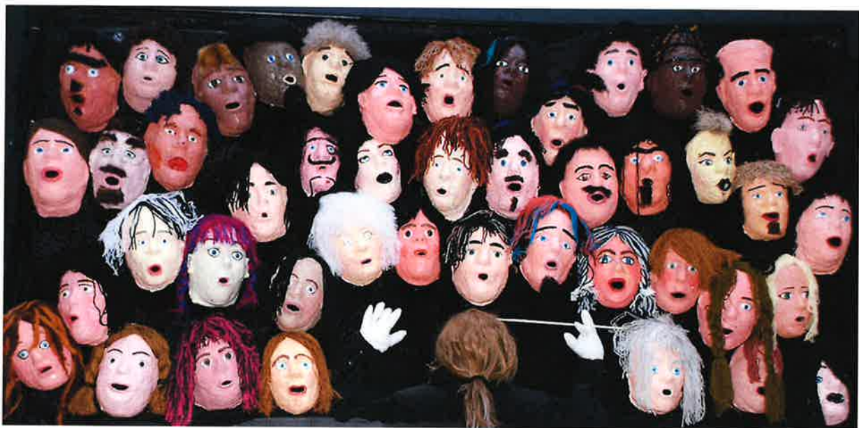
Fra ekskursjon Fosen vg skole 2012

Sted: Norsk kulturskoleråds lokaler i Fjordgt. 1 Tidspunkt: Kl 10:00 – 12:30